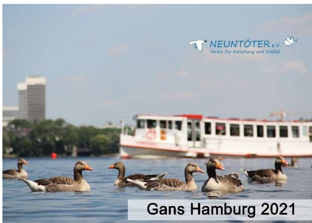
Fotokalender "Gans Hamburg 2021".

Seit 1988 werden Graugänse in Hamburg markiert. Bisher gab es noch keinen bestätigten Fall von Formen der „Vogelgrippe“ unter den rund 5.500 markierten Graugänsen (Stand 31.12.2020).