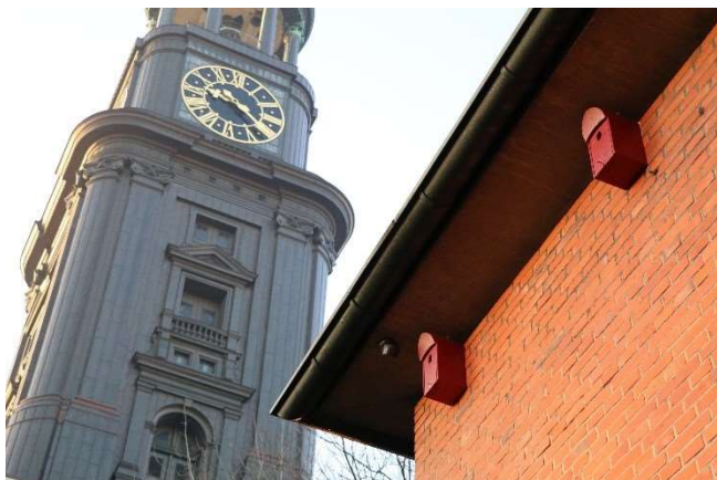
Rund um den Michel könnten bald Spatzen wohnen. (S.Hinrichs)

Im letzten Jahr haben wir 451 Nistkästen montiert (323 Haussperling, 77 Star, 36 Mauersegler, 15 Halbhöhlen).