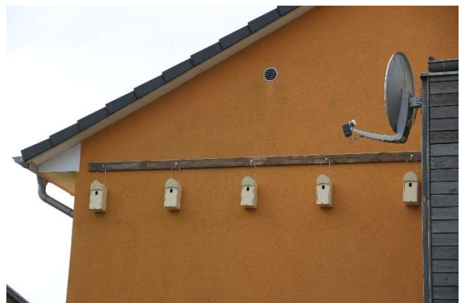
Auch an gedämmten Fassaden kann man Nistkästen montieren. (S.Hinrichs)