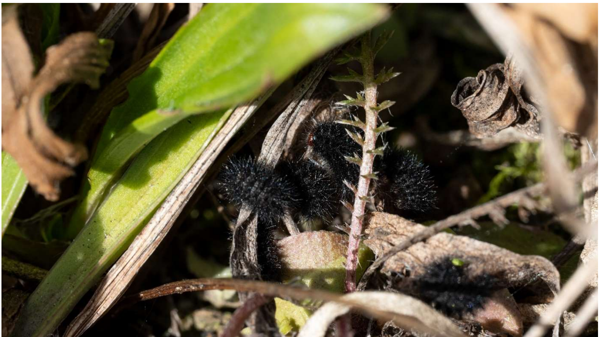
Die ersten Scheckenfalter-Raupen der Saison

Mit drei Personen unternahmen wir eine kleine Suche nach den Eiern des Nierenfleck-Zipfelfalters, bisher konnten 18 Stück gefunden werden.