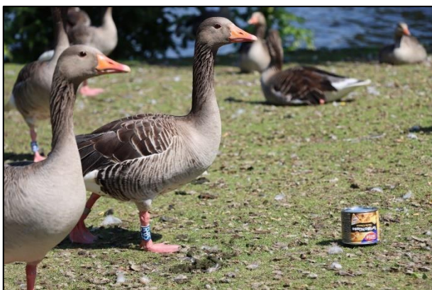
Ganter "R85" und Partnerin am 11. Juni am urbanen Mauserplatz an der Außenalster (Schwanenwik)

Ein Beispiel für spannende Wiederfunde ist Ganter „R85“, Jahrgang 2018, Hamburg-Uhlenhorster, „Einzelkind“, bzw. das Geschwister lebte nur wenige Tage. Seit 2019 kehrt er nur noch zur Mauser zurück in die „Heimat“ und mausert jedes Jahr auf der Außenalster. Das heißt man sieht ihn nur noch im Mai und Juni in der Stadt.