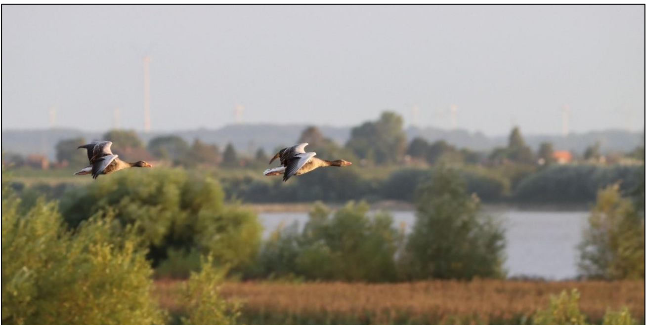
Grauganspaar zieht entlang der Elbe durch die Wedeler Marsch

August ist die Zeit der spannenden Wiederfunde. Nur sehr wenige Graugänse verbringen den Sommer in der Stadt. Momentan konzentrieren sich die Gänse tagsüber auf einzelne größere Rastplätze, an denen sie den Tag verbringen; morgens und abends fressen sie dann auf Wiesen und (Stoppel-)Feldern. Diese Eigenschaft ist sehr praktisch, denn aktuell lassen sich die beringten Gänse aus unseren und anderen Projekten recht gut an solchen größeren Rastplätzen ablesen.