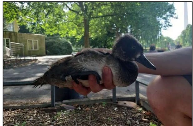
Junge Reiherente frisch beringt

Interessanterweise hatten wir drei der diesjährigen Mütter in den letzten Jahren als nichtflügge Jungvögel dort beringt. Diese Art brütet immer recht spät, erst im Juni/Juli schlüpfen die Küken.