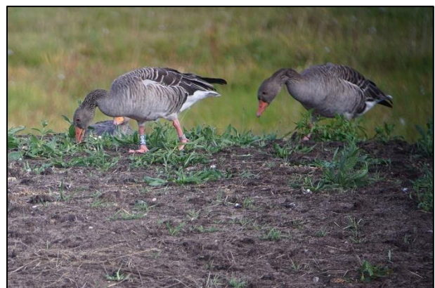
Ganter "R85" und Partnerin am 27. August in Bremen auf der Borgfelder Kuhweide / Kreuzdeich (R. Lühr)