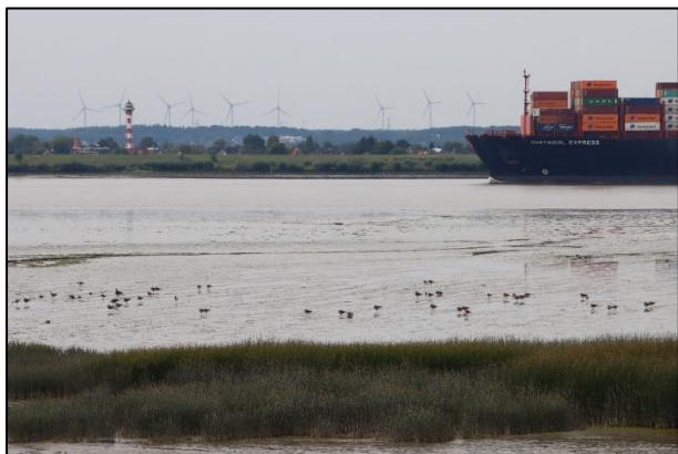
Rastende Graugänse im Watt der Wedeler Marsch

Im September verlassen viele Graugänse die Unterelbe westlich von Hamburg, wo viele von ihnen zuvor die Sommermonate verbracht haben. Es findet praktisch ein Wechsel statt, denn nun erscheinen dort die ersten arktischen Gänse, v.a. Bläss- und Weißwangengänse. Spannend ist, dass man zwar den ganzen Sommer über Graugänse entlang der Unterelbe beobachten kann, aber es sind nicht immer dieselben. Durch unsere Beringungen konnten wir feststellen, dass viele Graugänse nur zu bestimmten Zeiten bestimmte Rastplätze aufsuchen und sie dabei oft ziemlich mobil sind. Beispielsweise suchen viele Gänse im Juni nach der Mauser die Unterelbe auf, vermutlich um sich erstmal wieder zu stärken.