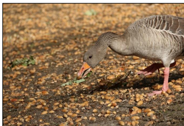
Graugänse fressen sehr gerne proteinreiche Eicheln, wie hier am Kuhmühlenteich

Viele Hamburger Graugänse ziehen nun weiter in (häufig noch) unbekannte Gebiete, bevor sie dann im kommenden Jahr in die Hansestadt zurückkehren. Ein Teil von ihnen erscheint in diesen Tagen kurzzeitig in der Stadt, vor allem wenn es viele Eicheln gibt, so wie in diesem Jahr. Dann suchen die Graugänse bestimmte Parks mit entsprechenden Bäumen auf und stärken sich dort für die kalte (?) Jahreszeit.