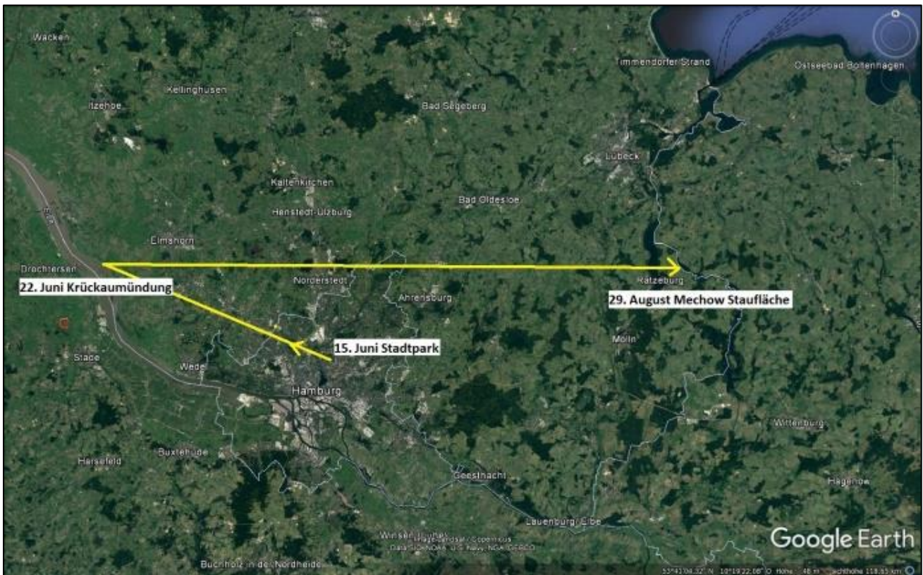
Sommerwiederfunde von Ganter 55C (Jahrgang 2016)